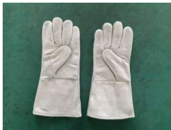
Рис. 4 – Перчатки для чистки канализации HONGLI