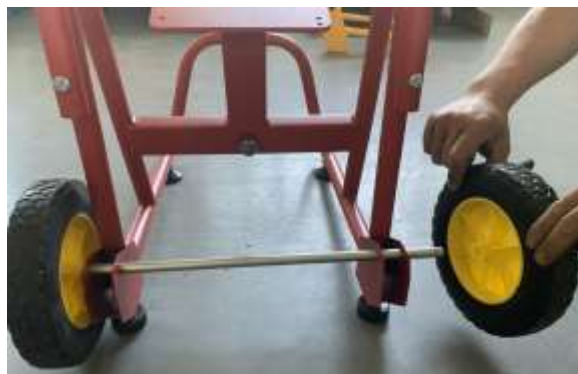
Рис. 3 – Установка колес