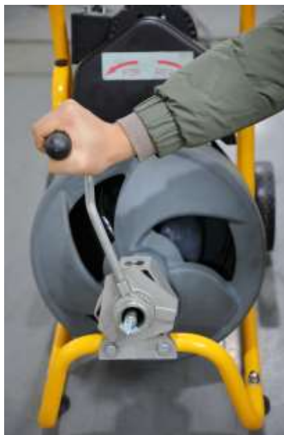
Рис 6 – В рабочем положении, подаваемая ручную спираль

Такое рабочее положение может сохранять управление тросом и прочистной машиной. (См. рис. 6.)